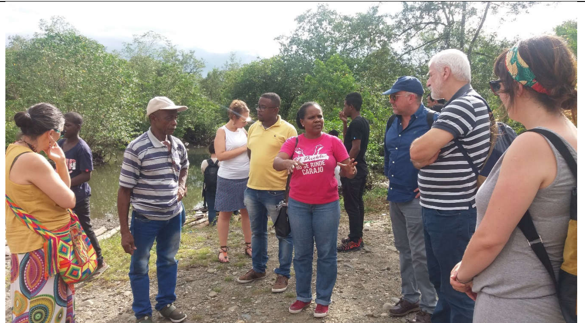
Finca La Trinidad, Vereda Lomitas, Santander de Quilichao (Caucako iparraldea): MEGAPROIEKTU HIDROELEKTRIKOAK (La Salvajina presa) eta MONOLABOREAK (azukre-kanabera)

Caucako Iparraldeko eskualdea historikoki afrikarren ondorengoan, indigenen eta nekazarien erkidegoek okupatu dute. Kokapen geostrategikoa du, Kosta Pazifikoarekin eta herrialdearen erdigunearekin lotuta baitago, eta aberastasun hidrikoak dauzka (Cauca ibaia eta haren ibaiadarrak). Ondorioz, oso erakargarria da baliabide naturalak ustiatu eta “garatzeaz” arduratzen diren proiektu handientzat. Azukre-kanaberen monolaboreen eta La Salvajina (Suárez) megaproiektu hidroeletrikoaren 6 eraikuntzaren eta ustiapenaren zioz, antzinako lurrak kendu, nahitaezko lekualdaketak eragin eta ingurumen-ondorioak sortu ziren. Horrez gain, kontuan hartzekoak dira pinu eta eukaliptoaren laboreak, legez kanpoko meatzaritza (urrea eta hidrokarburoak), legez kanpo erabiltzen diren laboreak eta narkotrafikoa.